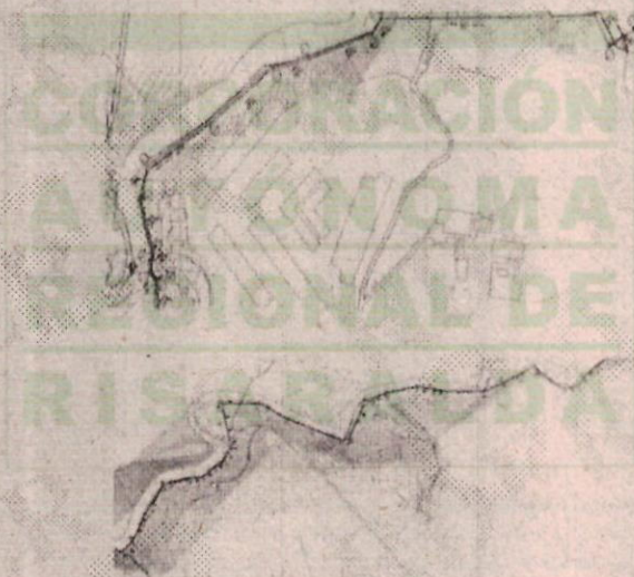
Figura 2. Localización punto para permiso de ocupación de cauce. Desde Cámara 193 a Cámara 227