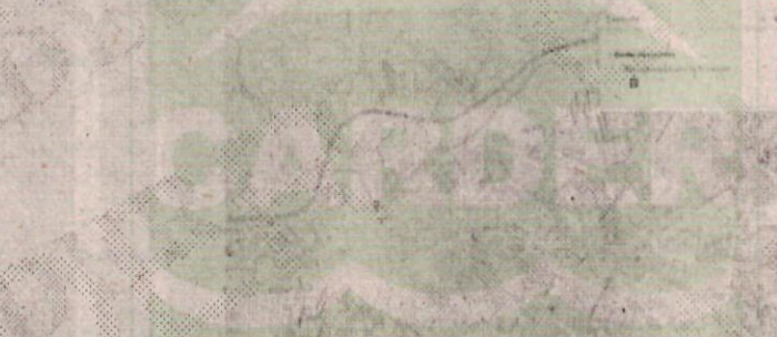
Figura 1. Localización punto para permiso de ocupación de cauce. Desde Cámara 159 a Cámara 183

(...) Observaciones: Se hace verificación en el aplicativo GeoCARDER para identificar localización, se evidencia que el predio NO SE ENCUENTRA dentro de la zonificación de áreas protegidas del Departamento; corresponde a la margen izquierda zona de retiro o faja protectora de la Quebrada Dosquebradas en el sector Barrio Inquilinos del Municipio de Dosquebradas. Como se muestra a continuación.